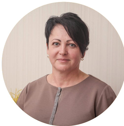
Генеральный директор ООО «Труд»

Натюрморт, который раскинулся на столе директора, будит не только аппетит, но и наше журналистское любопытство: угольно-черный черный хлеб, белая сдоба в крапинку, ассорти из сухариков, янтарное печенье, причудливой формы пирожные, пироги, и венец творчества – авторские караваи различной формы с тонко вылепленными из теста украшениями. Сегодня предприятие производит более 150 видов изделий.