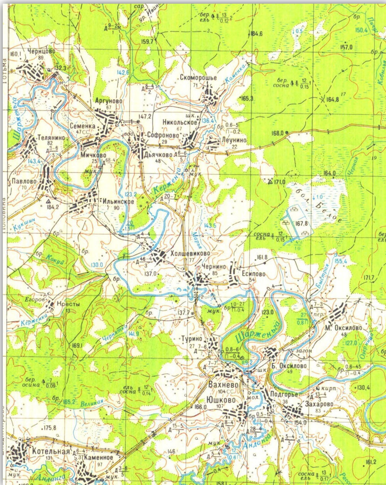
1959 г. – Деревни бывшего прихода Михайло-Архангельской Шарженгской церкви