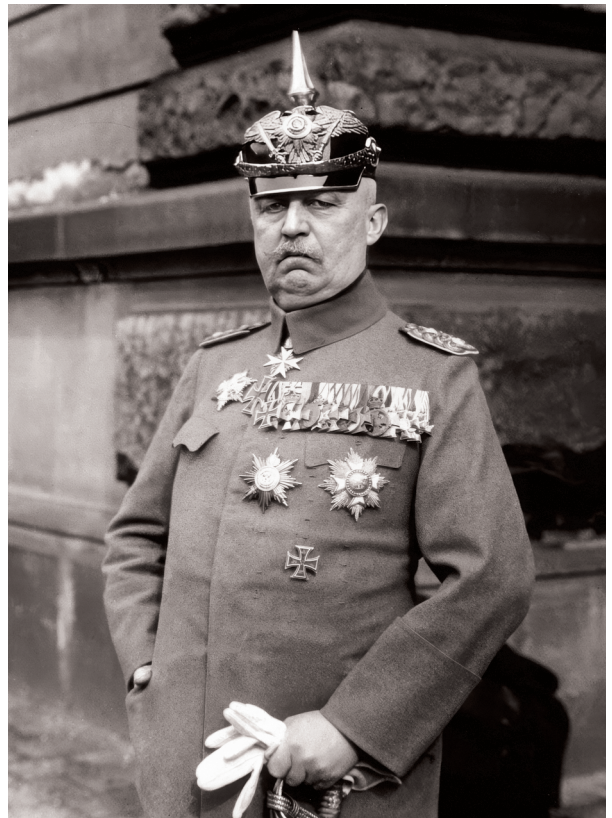
Германский генерал Людендорф