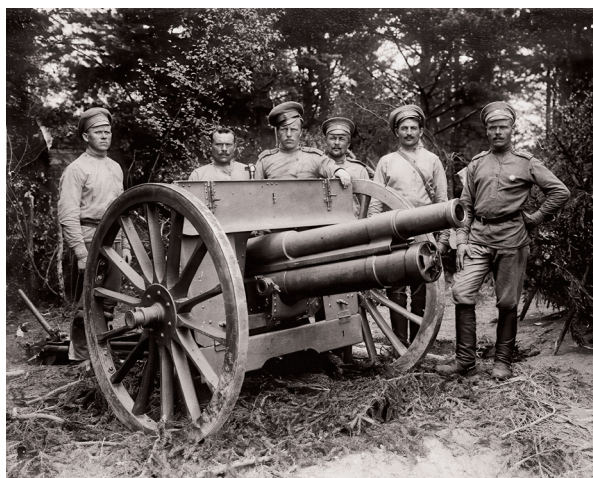
Русское трехдюймовое полевое орудие образца 1902 года

Деникин, считая себя союзником Антанты, открыто провозглашал антигерманские лозунги. При таком положении дел рассчитывать на немецкую помощь он не мог. Однако помощь от Антанты была явно недостаточной, и Деникину хотелось получать оружие и боеприпасы, как их получал атаман Краснов, еще и от немцев. Приходилось идти на всякие хитрости: представитель Добровольческой армии генерал А. С. Лукомский просил атамана Краснова «под видом снабжения Дона» выпросить у Киева оружейные припасы для Деникина. Атаман Краснов просьбу выполнил, хотя его и возмущало, что Деникин, презиравший немцев, использовал его, атамана П. Н. Краснова, как посредника. «Да, да, господа! — восклицал Краснов. — Добровольческая армия чиста и безгрешна. Но ведь это я, донской атаман, своими грязными руками беру немецкие снаряды и патроны, омываю их в волнах Тихого