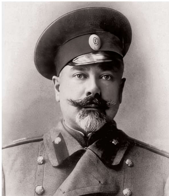
А. И. Деникин

Предводители Добровольческой армии всячески пытались доказать союзникам, Антанте, что они верны союзническому долгу, которому при царе была верна Россия. Но для бывших «союзников» Россия, в которой пылала гражданская война, превращалась в объект совсем других интересов: «...и немцы, и французы, и англичане едут в Россию не для России, а для себя, чтобы урвать с нее, что возможно...», — писал П. Н. Краснов [381]. И с этим нельзя не согласиться. Антанта