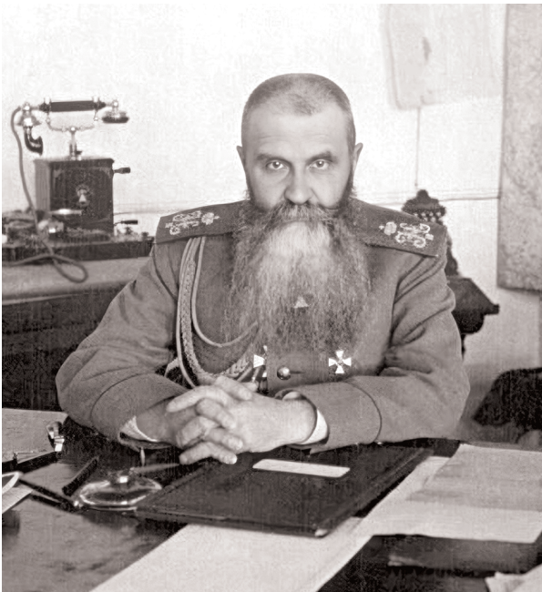
Генерал от артиллерии Н. И. Иванов, 1918 г.

Дона и чистенькими передаю Добрармии! Весь позор этого дела лежит на мне» [382].