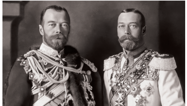
Николай II и его брат, король Англии Георг V