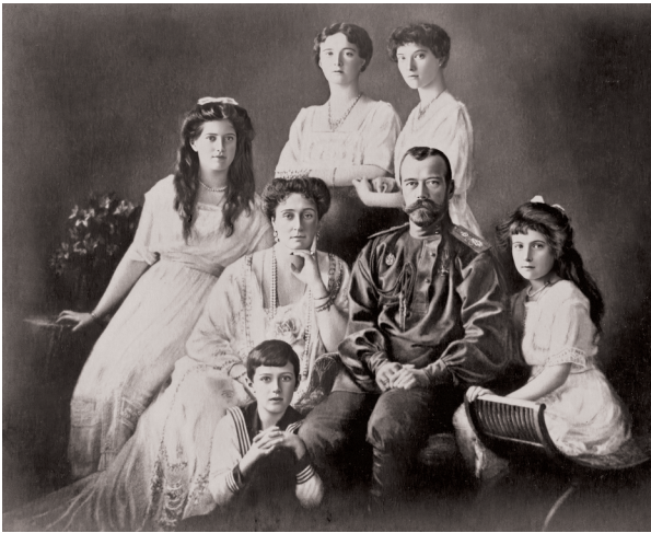
Император Николай II с семьей