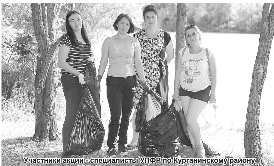
Участники акции - специалисты УПФР по Курганинскому району

В акции «Чистые берега - чистая вода!» приняли участие более 80 человек, собрано 20 куб. м мусора, убрано около 2 км береговой линии реки Лаба. Среди самых активных участников - коллективы МУП «Благоустройство Услуга», МУП «Курганинсктеплоэнерго», МАУК «Кинотеатр «Победа», ГУ «Центр занятости населения», МАУК «Курганинский КДЦ», МАУК «Радуга», МАУК «Курганинский исторический музей», отдела по делам молодежи; ДОСААФ, отдела по физической культуре и спорту, МУП «Благоустройство», МУПА «Курганинское», Управления социальной защиты населения, Управления Пенсионного фонда,