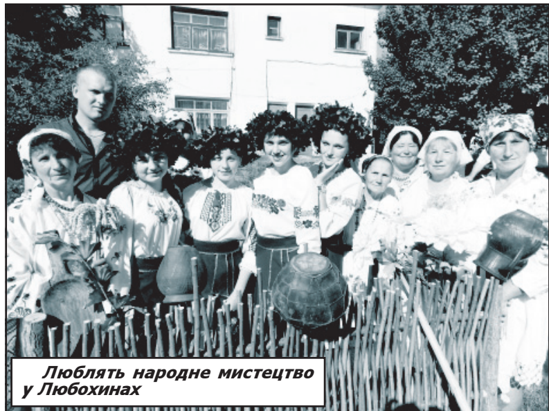
Люблять народне мистецтво у Любохинах