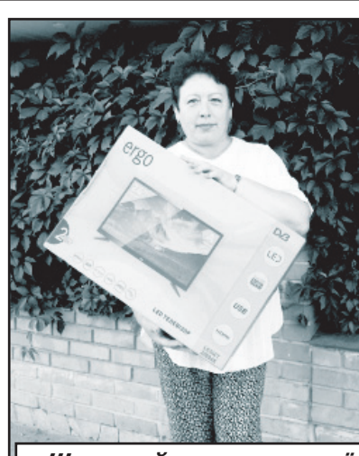
Щасливий призер лотереї

— "Картопля Полтавщини" с. Глухи. До речі, з метою покращення благоустрою селища "Волинь — Еліта Плюс" подарувала виробничому управлінню житлово-комунального господарства 50 кушів троянд.