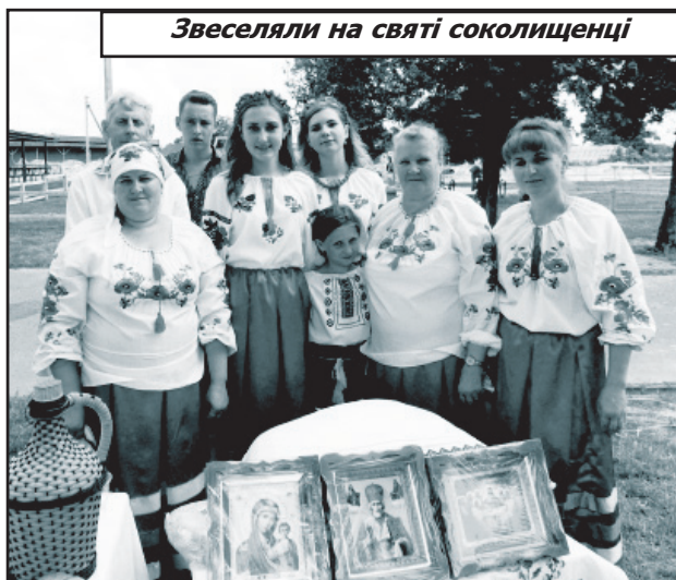
Звеселяли на святі соколищенці