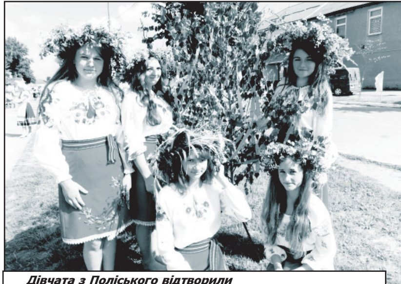
Дівчата з Поліського відтворили купальський обряд

Подяками було відзначено найвдаліше і найгарніше оформлення етнографічних майданчиків Седлищенського та Поліського будинків культури.