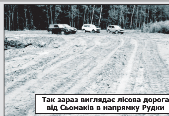
Так зараз виглядає лісова дорога від Сьомаків в напрямку Рудки

— А буквально за якихось кількатижнів вона почне відпадати від стовбура і сосна, яка