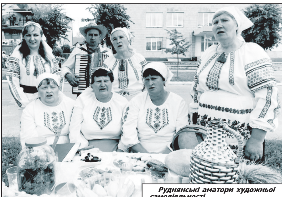
Руднянські аматори художньої самодіяльності.

На святі можна було скуштувати і смачні страви української кухні, частину з яких готували прямо на вулиці — аж дух забивало від аромату того шкварчання-смаження. Тут тобі і пухкі пиріжки, і рум'яна домашня ковбаса, і соковиті шашлики, і вареники, і, звісно ж, продукт, без якого вже неможливо уявити українця, — апетитне сало. З нагоди свята дехто не відмовляв собі і в чарочці доброї горілки.