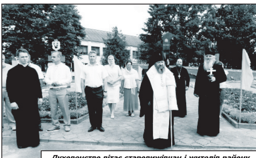
Духовенство вітає старовижівчан і жителів району

Потім на концертному майданчику біля райо-