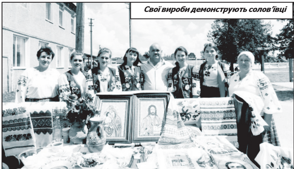
Свої вироби демонструють солов'івці