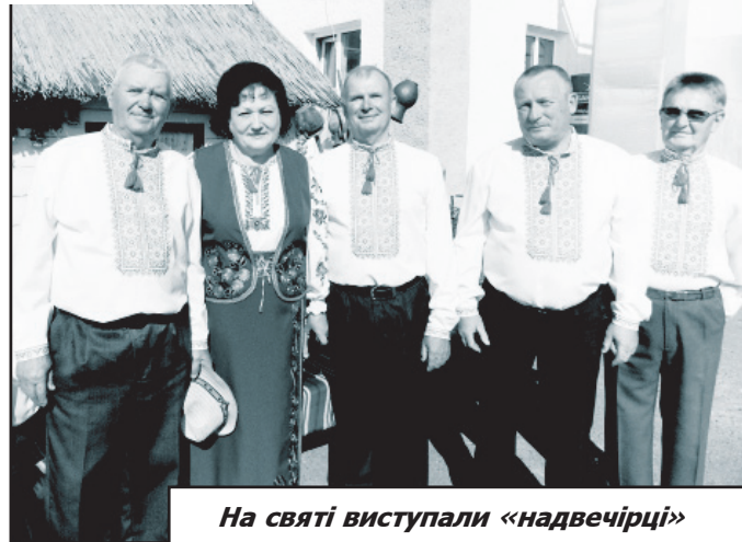
На святі виступали «надвечірці»

Стільки у всіх цих виступах було тепла, світла, радості, надії, любові!.. Безумовно, поважному журі було нелегко визначити найкращий. І все ж, перше місце дісталось фольклорним колективам із Дубечного-Мокрого, Кримного, друге — Старої Виживки, третє — Пол-