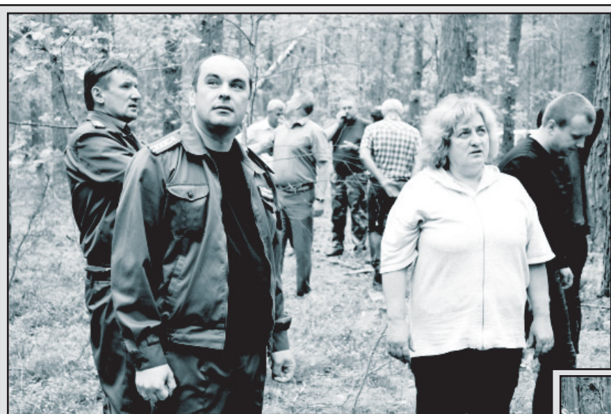
Учасники поїздки оглядають верхівки дерев, які сохнуть

Підприємством викопано одне із камінь-кашмирських підприємств, яке має необхідну техніку, швидко і якісно справляється із поставленими завданнями. Поруч ми плануємо облаштувати проміжний склад для відвантаження деревини, рекреаційну зону. Стараємось також на прохання жителів Сьомаків допомогти їм покращити дороги в інших напрямках. За кілька днів запланованих 5 кіло-