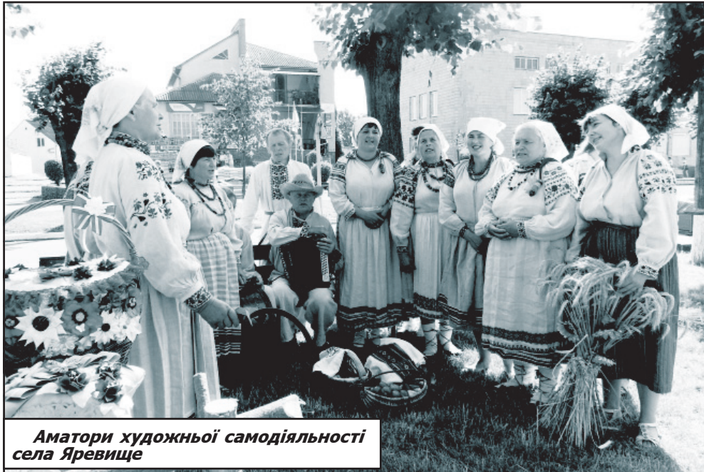
Аматори художньої самодіяльності села Яревище