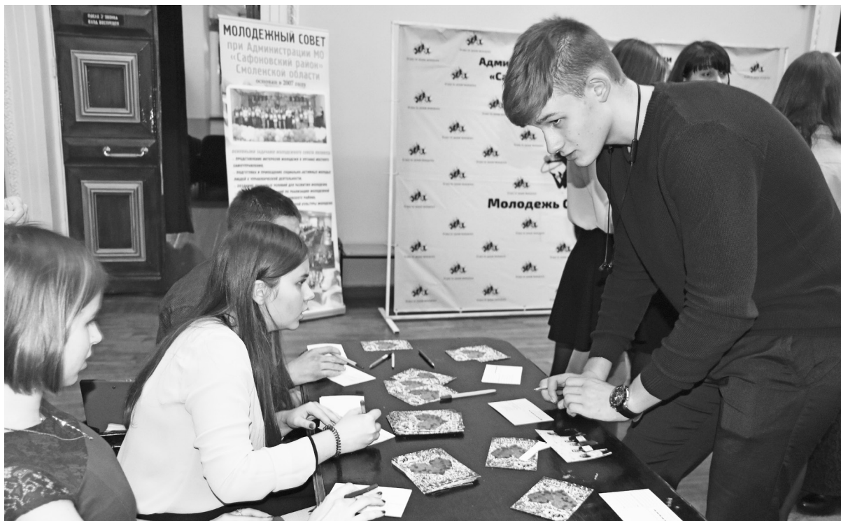
♦ Волонтерский корпус организовал акцию «Благодарю»