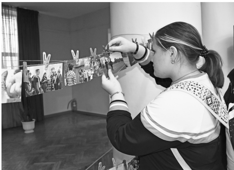
♦ Фотовыставка добрых дел

благородную миссию бескорыстной помощи людям: донорам, педагогам дополнительного образования, волонтерам предприятий города и образовательных учреждений.