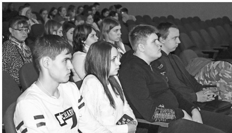
♦ Выступление не оставило равнодушным никого в зале