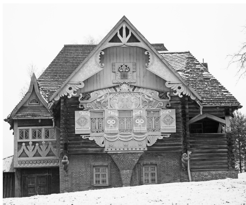
♦ Во Фленове сегодня

В 1901 году Тенишева провела в Смоленске выставку изделий прикладного искусства, изготовленных в Талашкине, открыв одновременно в Москве, в Столешниковом переулке, магазин «Родник» для их продажи. В эти годы в Талашкине по ее инициативе был построен удивительный малютинский «Теремок», все предметы убранства которого были сделаны в мастерских.