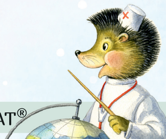
СХЕМА ПРИМЕНЕНИЯ ПРЕПАРАТА ДЕРИНАТ®

0,25% раствор для местного и наружного применения